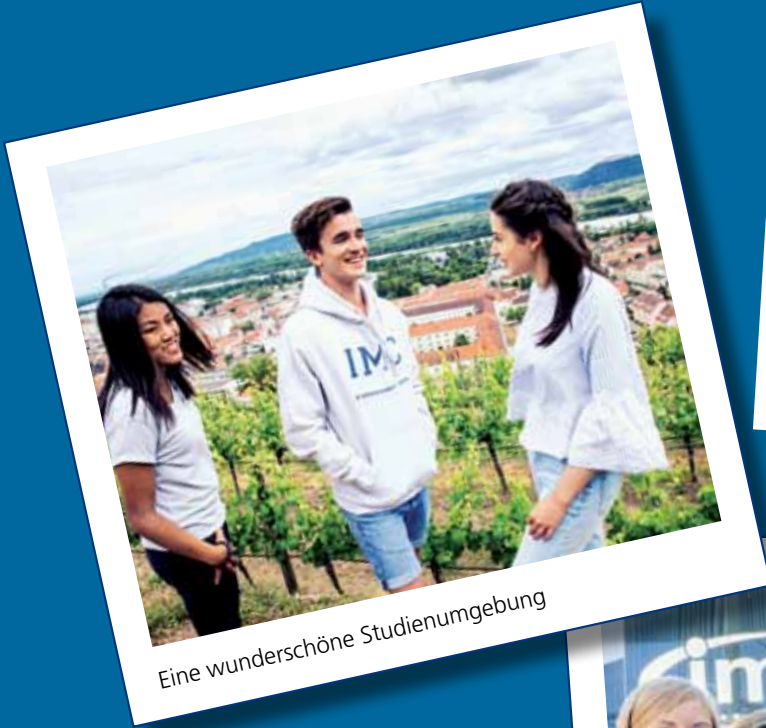
Eine wunderschöne Studienumgebung