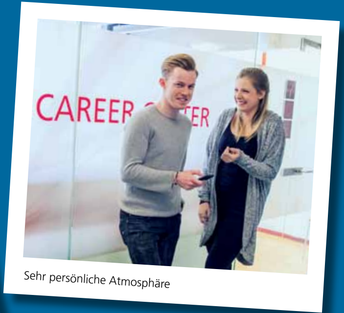
Sehr persönliche Atmosphäre