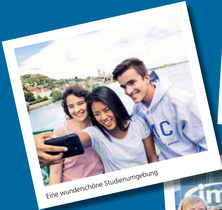
Eine wunderschöne Studienumgebung